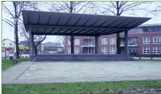
Lovinckplein: dorpsspodium met op de voorgrond de jeu de boulesbaan.