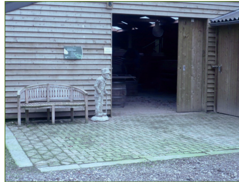
Grote schuur "Ròwkoelehof"

De grote schuur met toegangsdeur van "Ròwkoelehof" is vrij toegankelijk. In deze schuur staan allerlei landbouwwerktuigen, dorskasten, wanmolens, karren, koetsen, gereedschap, machines, enz. Graag zien wij dat U ons gastenboek tekent. Eventuele op- of aanmerkingen kunt U daarin maken! Ook in de open schuur met de naam "De schop" zijn diverse landbouwwerktuigen, gereedschappen, gebruiksvoorwerpen, enz. te bezichtigen.