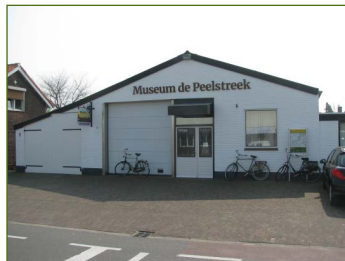
Museum "de Peelstreek" Ysselsteynseweg 113